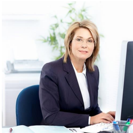
Практически умения и опит